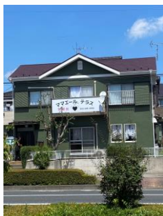
あきる野市 睦橋通り 「野辺」交差点の角 無料駐車場（3台分）あります。